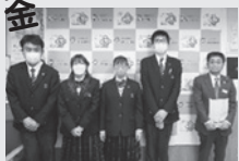
北斗高等支援学校 様