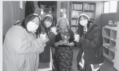
サンタクロース活動の様子