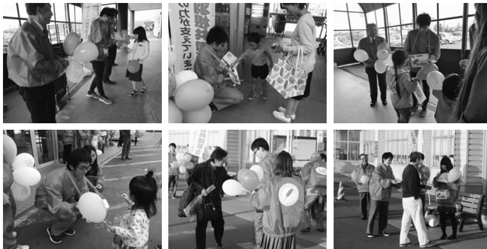
イオン様、魚長様、生協様の店舗前でおこないました