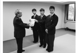
北斗高等支援学校様