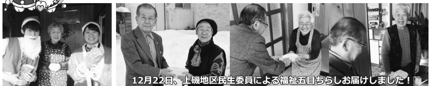
12月22日、上磯地区民生委員による福祉五目ちらしお届けしました！

12月5日現在、 1,949,506円 の募金が集まっております。皆様からの募金は、歳末福祉見舞金、福祉五目ちらし、サンタクロース活動事業に使われています。ご協力ありがとうございます。