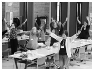
皆で元々よくラジオ体操