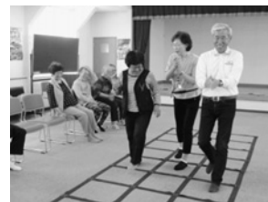
隣の方と手拍子とステップは揃ってるかな~?