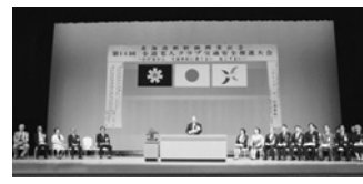
（全道老人クラブ交通安全推進大会を開催）