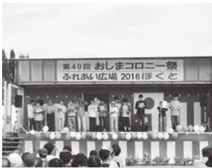
おしまコロニー祭

10月2日に第49回おしまコロニー祭ふれあい広場2016「ほくと」、また第45回美ヶ丘収穫感謝の日北斗ふれあい広場2016 in 美ヶ丘がおこなわれました。当日はイベントの他、模擬店などもあり大盛況で楽しい1日でした。