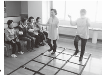
七重浜西永交クラブ