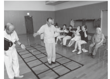
久根別高砂クラブ

社協では、歩行機能や認知機能の改善に効果が得られる「ふまねっと運動」を通して地域とのつながりや絆を深め、地域住民がいつまでも元気で互いに支え合って暮らすことができる地域づくりを目指して、市民の皆さんに無料で「ふまねっと」の貸出しと、依頼があった場合、サポーターの派遣を行っております。