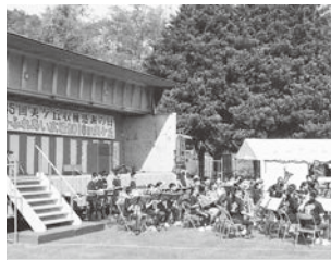
美ヶ丘収穫感謝の日