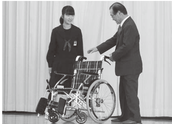
大野中学校による 車椅子寄贈

大野中学校では、各家庭を生徒が回ってリングブルを集め、福祉施設へ車椅子を贈呈する活動を平成17年から行っており、これまでに8台の車椅子を寄贈しております。 今年約650kgのリングブルを回収し、北斗市社会福祉協議会に寄贈されました。本当にありがとうございました。