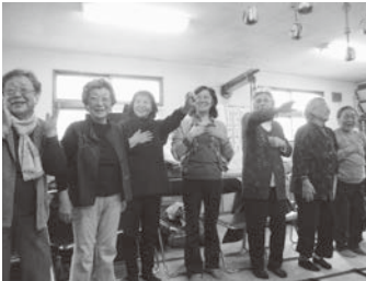
中野通中部自治会