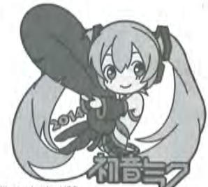
Illustration by U35 © Crypton Future Media, INC. www.piapro.net piapro