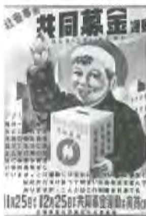
昭和22年（第1回ポスター）

この積み立ては、大規模災害が起こった際に、被災者を支援するための災害ボランティアセンターの開設・運営の資金や、被災した福祉施設・運営の資金など、被災地を応援するための資金として使われ、東日本大震災においても役立てられています。