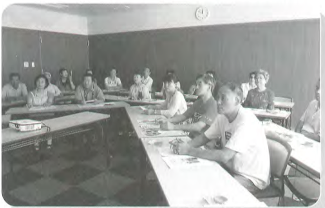
久根別みどり町会

社会福祉協議会では地域の会館等を利用して行うサロン活動事業を支援しています。今回は地域包括支援センターで行っている出前講座を4カ所で行いました。ご要望のある地区に出向き、介護予防の普及・啓発を行っています。介護が必要な状態を少しでも先送りにするお話し、認知症についてのお話し、軽体操などを行っています。